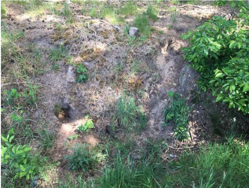
Verbeelding van locatie '1'.