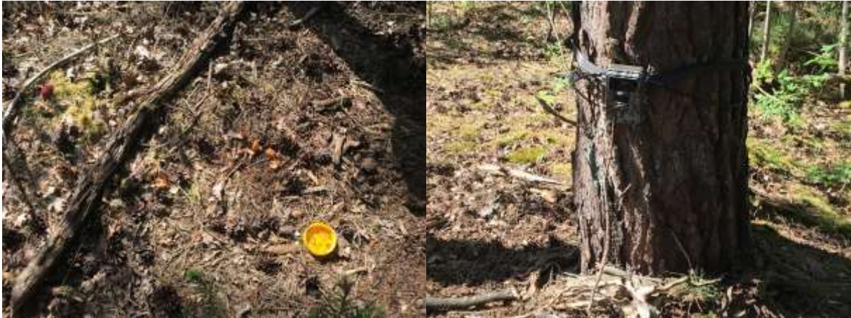
Links voer (appel en honing) op 2 meter naast hol 2/2. Rechts; de cameraval naast de voerplek.