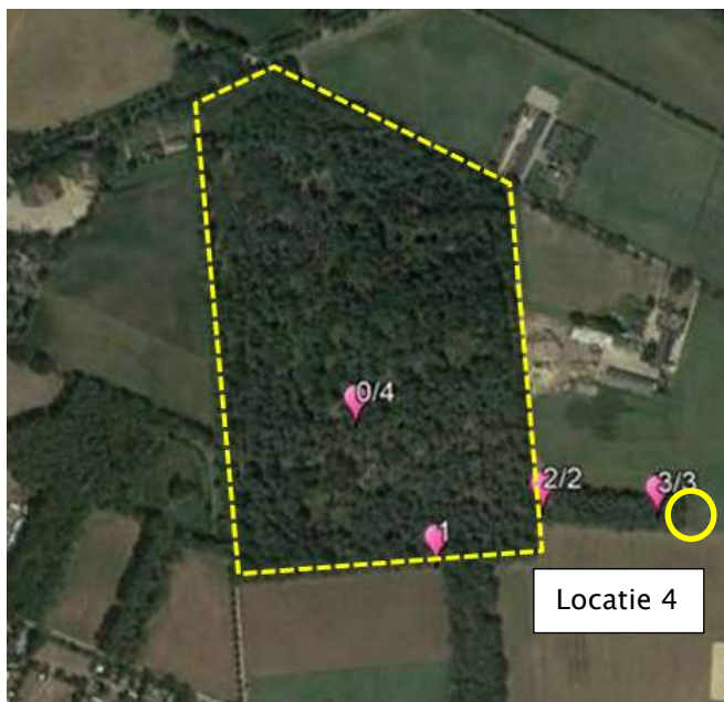
Aangetroffen graafsporen van de das in en rond het plangebied.