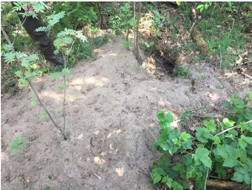
Verbeelding van locatie '2/2'.

Er is in 2020 gegraven door de das op deze locatie. In het zand voor de ingang waren de druppelinslagen van de regen van 3-4 mei nog zichtbaar. Deze waren niet verstoord door een dier dat gebruik maakt van de verblijfplaats. De aanwezige hopen worden niet actief bewoond in het voorjaar 2020. Nabij deze plek is een voerplek aangelegd en is een cameraval geplaatst. In de afgelopen weken is geen dassen waargenomen op deze locatie.